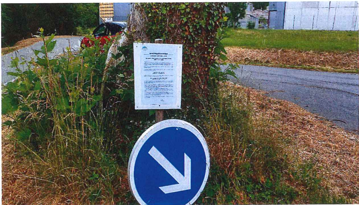
Entrée Chemin de Mounet par la route RD911 de Rochefort-Surgères